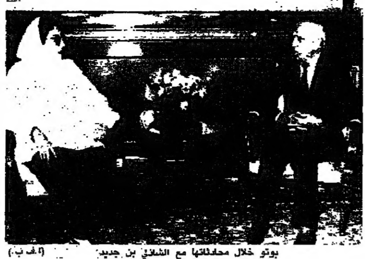
بوتو خلال محادثاتها مع الشاذلي بن جديد

علم من مصدر رسمي في المنامة ان رئيسة الوزراء الباكستانية بنازير بوتو. وصلت بعد ظهر امس الى المنامة. في زيارة ليومين في اخر محطة من جولة لها على خمس دول عربية. ويتوقع حسب المصدر ذاته. ان تبحث بوتو خلال الزيارة مع رئيس حكومة البحرين الشيخ خليفة بن سلمان ال خليفة. الوضع في كشمير والعلاقات الثنائية. وفي الجزائر. ابدت بوتو ارتياحها للمحادثات التي اجرتها مع الرئيس الجزائري الشاذلي بن جديد الذي يشارك الباكستانيين وجهة نظرم بالبنية للنزاع حول كشمير. بين الهند وباكستان. واعلنت بوتو في تصريح صحافي قبل مغادرتها ان الجزائر مثلها مثل باكستان تعتبر انه يجب تسوية النزاع في كشمير بالحوار والتفاوض. تحت اشراف دولي بين اسلام اباد ونيودلهي. وقالت بوتو ان الجزائر تؤيد ايضا اجراء استفتاء بشأن كشمير. واضافت ان وجهة النظر هذه. تبنتها باكستان باستمرار.